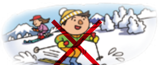
●個人でスキーに出かけた場合