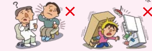
●むちうち症、腰痛などで、医学的他覚所見のないもの ●地震・噴火またはこれらによる津波によるケガ